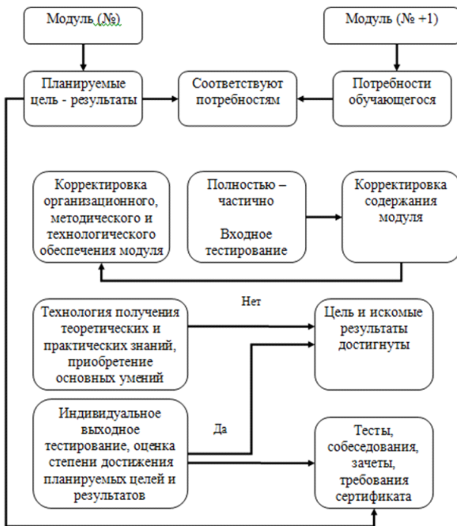
Типовая схема процедуры изучения модуля

Если при программированном и компьютеризированном обучении применяется достаточно жесткий алгоритм поэтапного усвоения учебного курса, то при модульном обучении траектория движения от одного модуля к другому не является строго фиксированной. Автономность модуля и в смысле логической увязки в нем учебного материала, его компетентности, и в смысле обособленной полноты учебно-методического обеспечения позволяет менять последовательность изучения модулей, исключать одни из них и добавлять другие без ущерба для целевой основы программы в целом. Необходимость варьирования модулями имеет своей целью оптимизировать процесс усвоения знаний, максимально освободить каждую конкретную группу слушателей от изучения второстепенного, балластного для нее материала, повысить коэффициент полезного действия образовательного процесса.